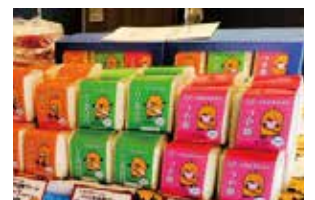
ねじりほんによ 「米キューブ」