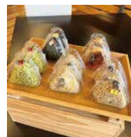
「くりはうおむすび」