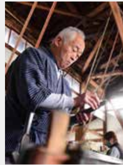
若柳地織はたや (宮城県知事指定伝統工芸品)