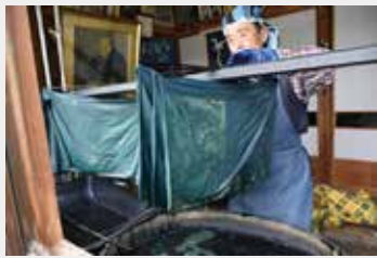
正藍冷染 (重要無形文化財)