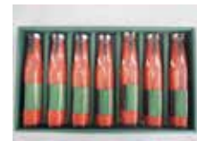
トマトハウス 夢風船 「TOMATOLOVERS」