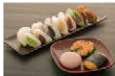
もちっ小屋でん 「しんこもち」