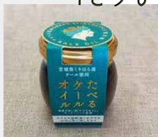
くりはうファーマーズ 「たべるケールオイル」